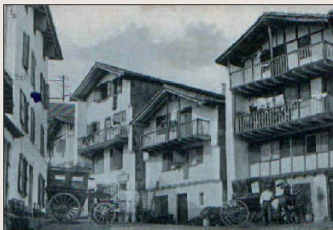
La rue Xerri Karrika de Cambo vers 1900